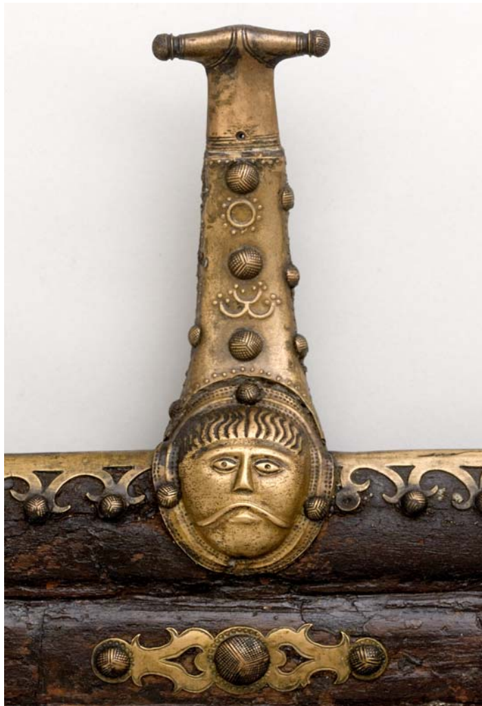
Detalje: Dejbjergvognen.