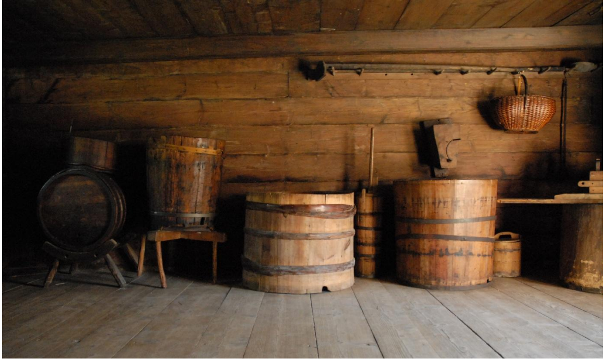
Trækar på Hallandsgården