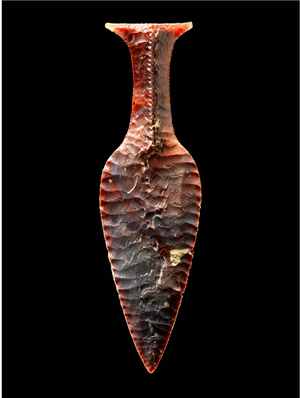
Hindsgavldolken, Danmarks Oldtid