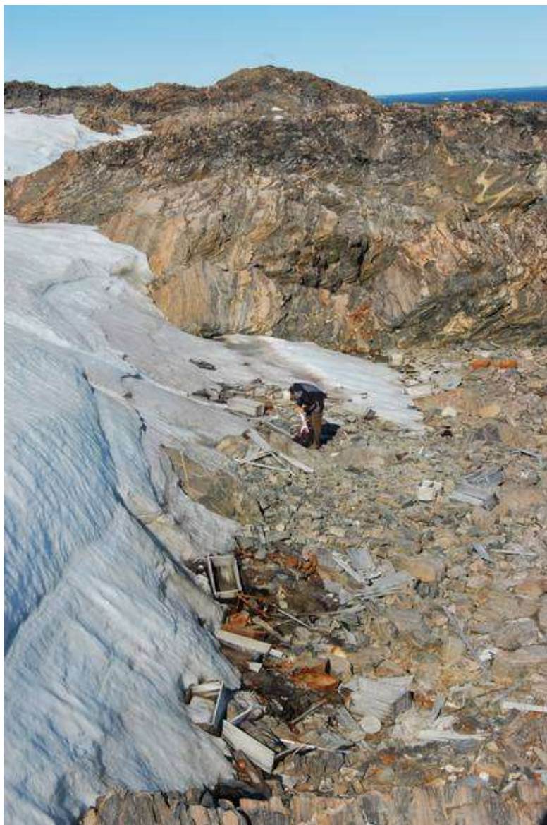
Billedtekst: Tyskernes "Grottestation" fra 1943-44 bliver gradvist frigivet af snefanen på Kap Sussi.

Nationalmuseet har i 2009 iværksat sin hidtil største tværgående forskningssatsning. Initiativet skal fra 2009- 2014 producere og formidle ny viden og indsigt om forholdet mellem menneske og miljø i de sidste 15.000 år i de nordlige områder med perspektivering til nutiden, hvor klimaændringerne er mærkbare.