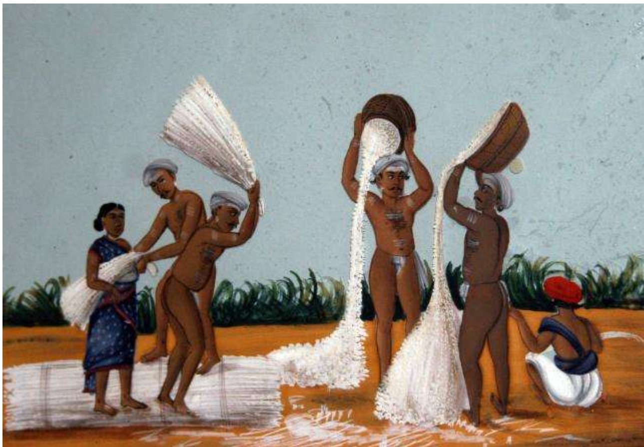
Billedtekst: Arbejdsscene malet af en indisk kunstner o. 1800.

I Tranquebar Initiativet samarbejder indiske og danske forskningsinstitutioner og myndigheder om udforskning af kulturmøder før og nu i Tranquebar. Dertil kommer restaurering af den fælles dansk-indiske kulturarv. Tranquebar, på østkysten af det sydlige Indien, var en dansk handelsstation fra 1620 til 1845.