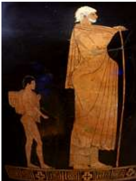
Billedtekst: Mand og slave.

Forskningsprojektet 'Pots, Potters and Society in Ancient Greece' er finansieret af Generalkonsul Gösta Enboms Fond og Nationalmuseet. Udgangspunktet er Nationalmuseets Antiksamlings store og varierende samling af græsk keramik, der er uden sidestykke i Nordeuropa. Samlingens kerne er Christian VIII's Vasecabinet, der efter kongens død i 1848 overgik til statseje og blev en del af Nationalmuseet. Den er efterfølgende blevet forøget med udvalgte erhvervelser gennem gaver og køb samt fund fra danske udgravninger på Rhodos (1902-1914).