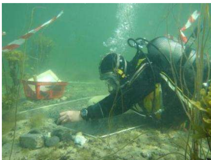
Billedtekst: Marinearkæolog undersøger en undersøisk stenalderboplads i Danmark.

SASMAP er et tre-årigt EU-projekt med start i 2012. Programmets overordnede målsætning er at fremme metoder og teknikker til brug for marinarkæologiske undersøgelser, som skal være med til at beskytte Europas undersøiske kulturarv. Projektet støttes med 16,5 mio. kr. og udføres af 11 partnere, som omfatter museer, universiteter, kulturarvsmyndigheder inklusiv 4 små og mellemstore virksomheder (SME). Bevaring & Naturvidenskab på Nationalmuseet er koordinator på projektet. Projektet kan følges løbende på www.sasmap.eu