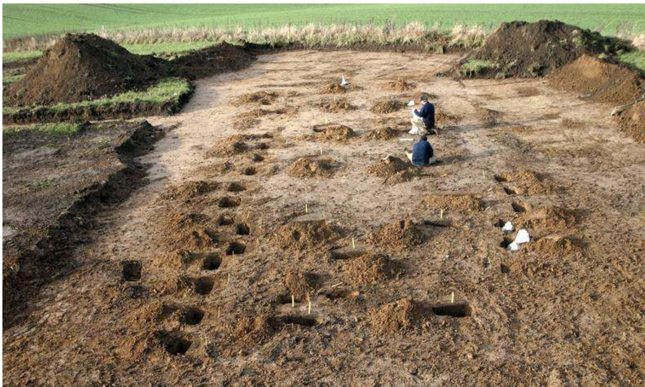
Billedtekst: Stolpehullerne dokumenteres, og der tages prøver af jordfylden til analyse.

Jellingprojektet er et forsknings- og formidlingsprojekt, der tager afsæt i de enestående monumenter i Jelling - et anlæg, der markerer såvel overgangen fra hedenskab til kristendom som etableringen af den danske kongemagt i vikingetiden.