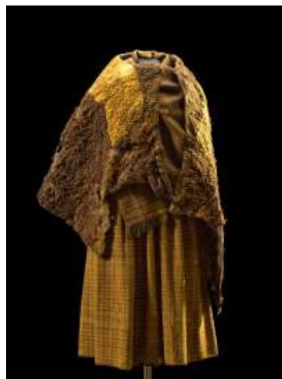
Billedtekst: Huldremosekvindens tøj

http://natmus.dk/footermenu/organisation/forskning-og-formidling/center-for-tekstilforskning/ctr-research-programmes/