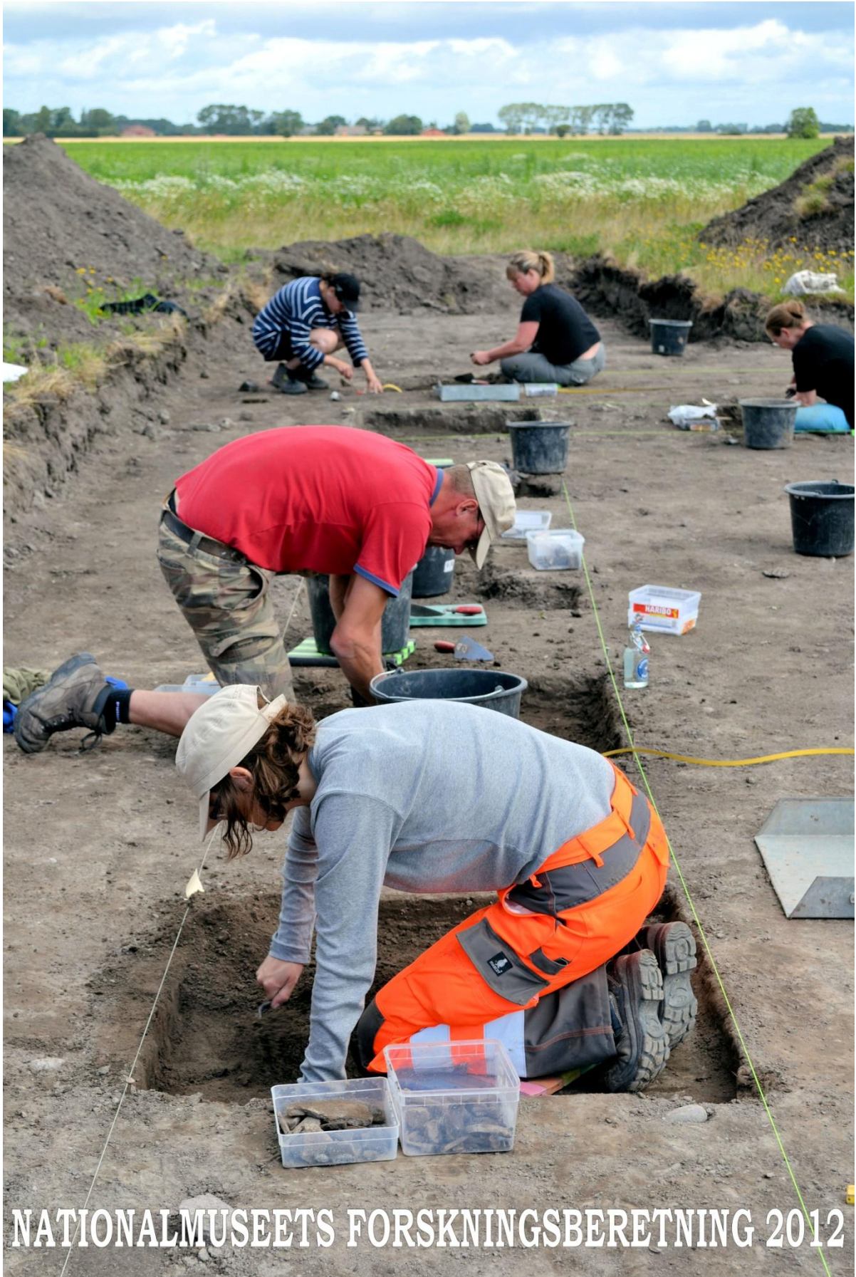
NATIONALMUSEETS FORSKNINGSBERETNING 2012