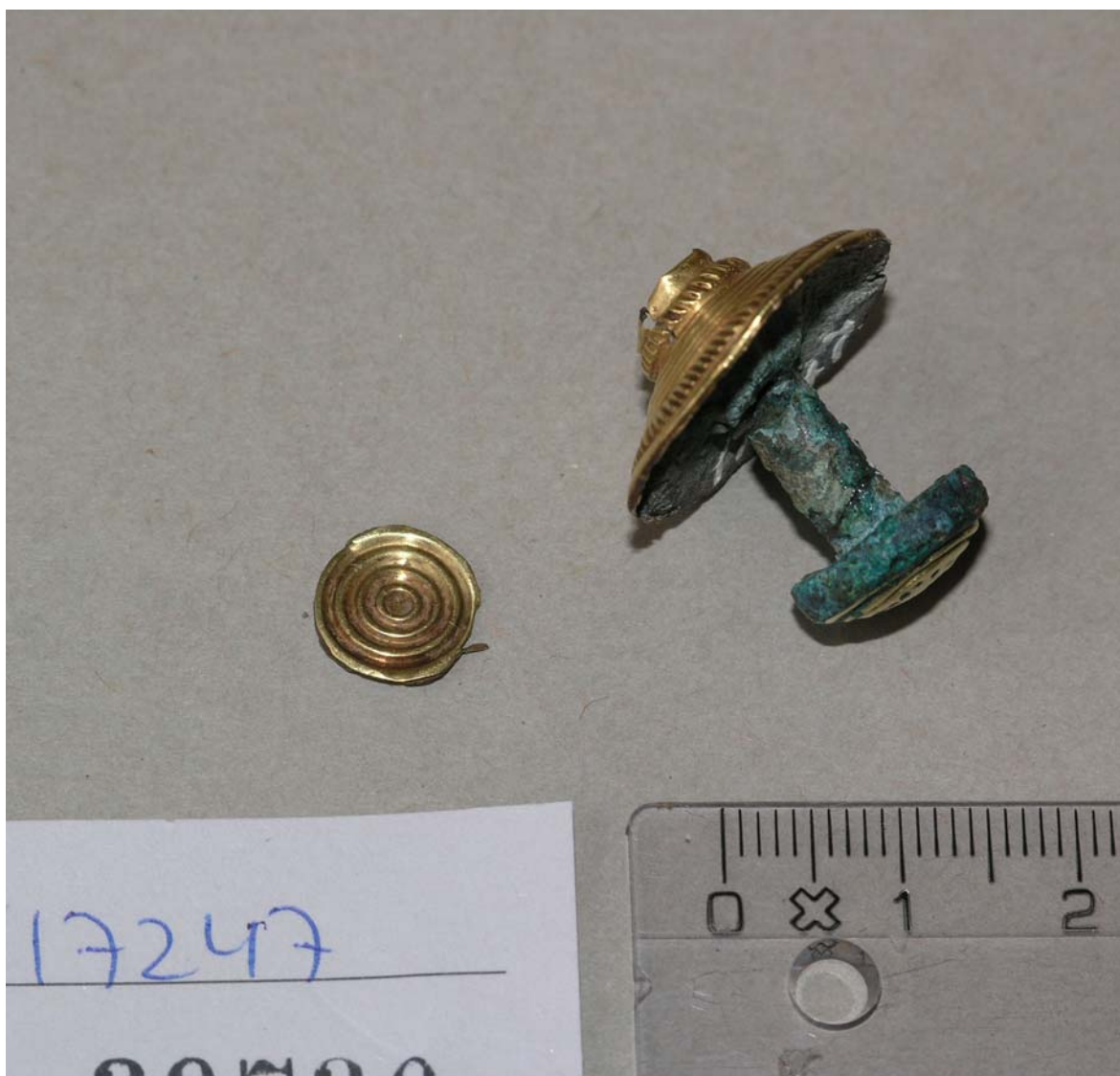
Bronzeknap, forgyldt, museumsnummer 17247, Vester Skjerninge. 4 dele, 3 med guld. Den løse hat hører til knappen, men der er ikke belæg for endelig placering. Derfor ligger den ved siden af. Udpeget ENB-genstand (dvs genstand af Enestående National Betydning)