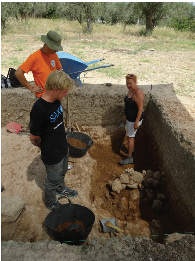
Udgravninger på felt nr. 1, som afslørede en mur fra byens tidlige fase.

Projektansvarlig: Silke Müth-Frederiksen. Finding Old Sikyon er et samarbejdsprojekt mellem Nationalmuseet, Det Danske Institut i Athen, og Det Græske Kulturministerium. Projektets formål er at identificere det førhellenistiske Sikyons præcise beliggenhed, som befinder sig i den nordøstlige del af Peloponnes. Ved hjælp af moderne ikke-invasive arkæologiske metoder beskrives byens strukturelle elementer, fx havne, gader, huse etc. Efterfølgende foretages udgravninger på udvalgte felter ud fra de præliminære resultater. Sikyon var berømt i oldtiden for sine kunstakademier for maleri og skulptur og havde også stor betydning for kunsthåndværk. Projektet er støttet af Carlsbergfondet og er forankret i Danmarks og Middelhavslandenes Oldtid