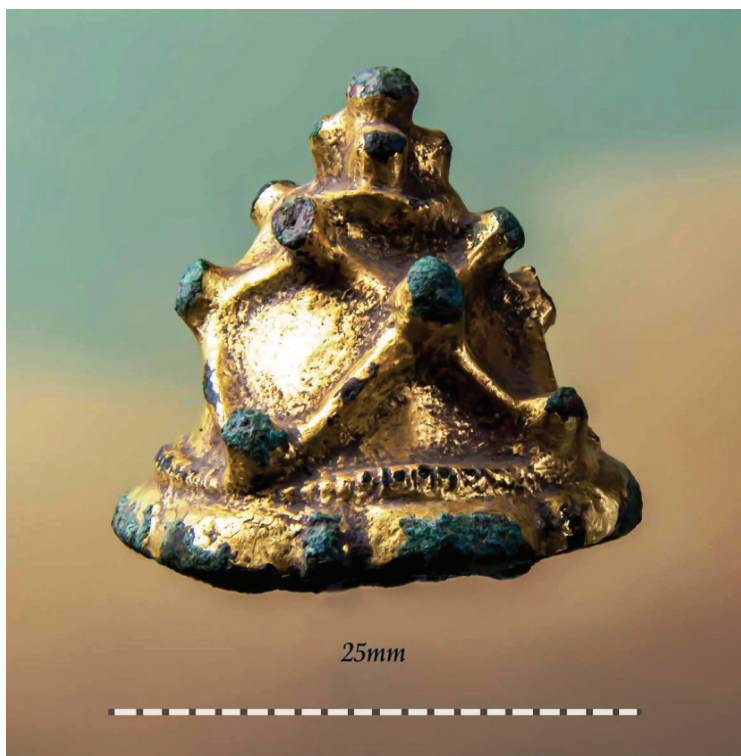
Detektorfundene fra Tissø imponerer stadig. Her en forgyldt pynteknap med mulige tekstilrester bevaret under bunden.