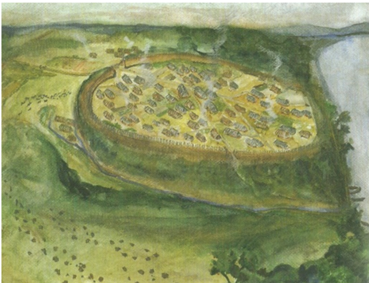
Rekonstruktionstegning fra bogen "Organizing Bronze Age Societies" af bronzealderbopladsen ved Szazhalombatta på den ungarske højslette ved Donaufloden. Tegning: Birgitta Kürtösi