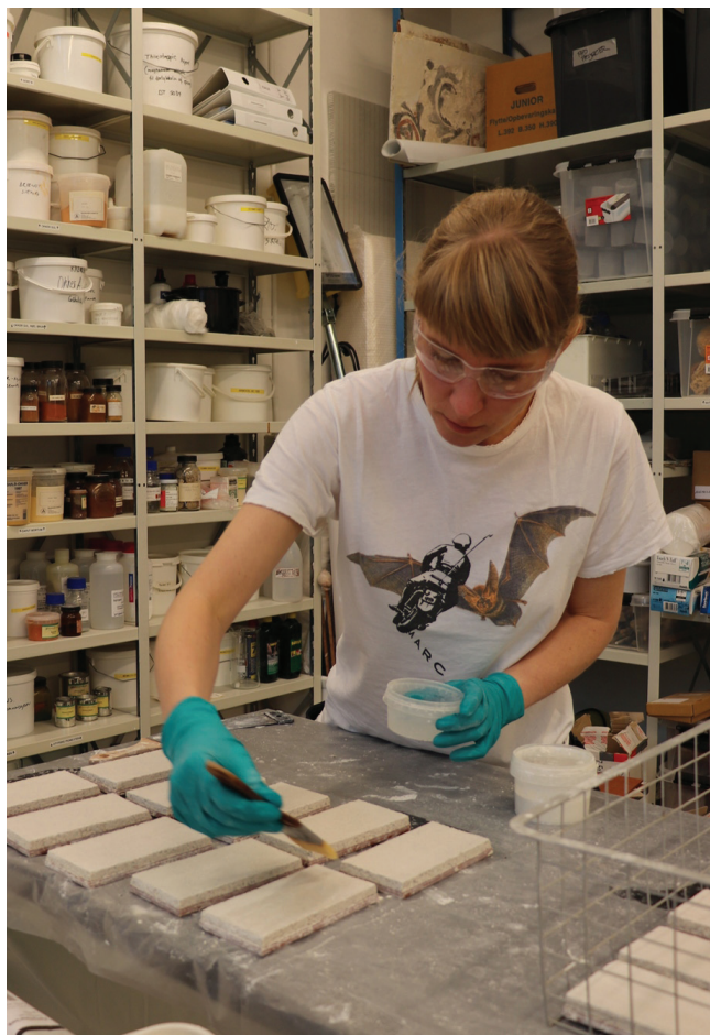
Testfliserne forberedes på kalkmaleriværkstedet.