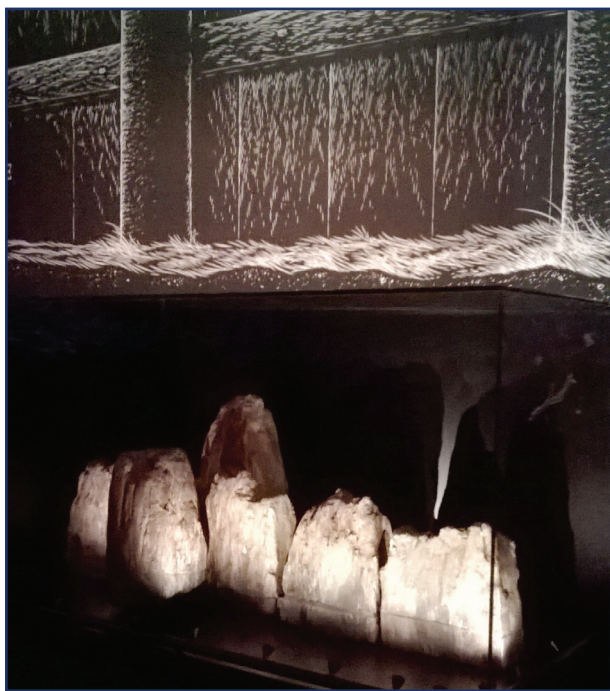
En udgravning i Smededammen i 2013 viste, at der endnu var bevaret tømmer fra den mægtige palisade i Jelling. Tømmeret blev færdigkonserveret i 2016 og er nu udstillet på Kongernes Jelling.

Projektansvarlig: Anne Pedersen. Jellingprojektet – et kongeligt monument i dansk og europæisk belysning er et forsknings- og formidlingsmæssigt samarbejde med forskere fra Aarhus Universitet, Københavns Universitet og VejleMuseerne. Jellingprojektet tager afsæt i de enestående monumenter fra 900-årene i Jelling – et monumentkompleks, der markerer såvel overgangen fra hedenskab til kristendom som konsolideringen af den danske kongemagt i vikingetiden. Projektet sigter mod at udbygge den eksisterende viden om Jellingmonumenterne og det landskab, de en gang var en del af ved hjælp af arkæologiske, historiske og naturvidenskabelige undersøgelser og analyser. Jellingkomplekset låner træk fra kendte monumenter og samtidige bebyggelser andetsteds i Danmark. Bygherrerne har uden tvivl også hentet inspiration udefra. Projektet inddrager derfor synsvinkler og perspektiver fra det øvrige Norden og Europa med henblik på at nå ind til forudsætningerne for den udvikling, der kan følges i Danmark og nabolandene i 900-årene. Målet for undersøgelserne af Jelling Kirke er at etablere et nyt helhedsbillede af det ældste stenbyggeri i Jelling og med Jelling som afsæt bidrage til forståelsen af de ældste kirker i Danmark og udbygningen af det danske kirkelandskab. Projektet er støttet af Bikubenfonden og er forankret i Middelalder, Renæssance og Numismatik.