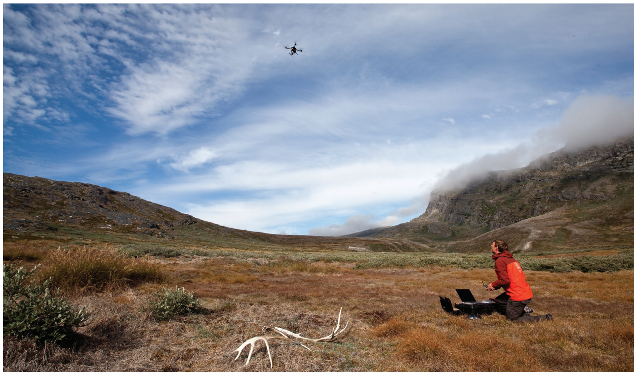
Ved hjælp af droner optages både højopløselige RGB billeder samt multispektrale billeder. Optagelserne bruges både til at kortlægge de arkæologiske lokaliteter, lave 3D modeller samt til undersøge og klassificere vegetationen på pladserne.