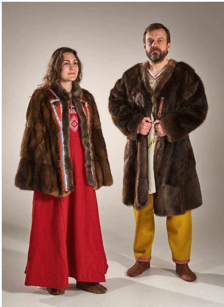
Den færdige kvinde- og mandsdragt, som er udarbejdet i Delprojekt 2. Rekonstruktionerne tager udgangspunkt i analyser af tekstil- og skindfundene fra Hvilehøj og Bjerringhøj.

I 2020 har Velklædt i Vikingetiden gjort arbejdet i Delprojekt 1 og Delprojekt 2 færdigt. Vi har primært formidlet projektet gennem vores Instagram-profil: @fashioningthevikingage, da Corona-pandemien har forhindret afholdelsen af de fleste planlagte formidlingsarrangementer. Det lykkedes dog at afholde et specialarrangement for VELUX FONDENS bestyrelse og senere et privat besøg af Hendes Majestæt Dronning Margrethe, hvor de færdige redskaber, tekstiler og dragter blev fremvist. Mere end 30 forskellige forskere og håndværkere har bidraget med viden og indhold til projektet. Vi siger stor tak til