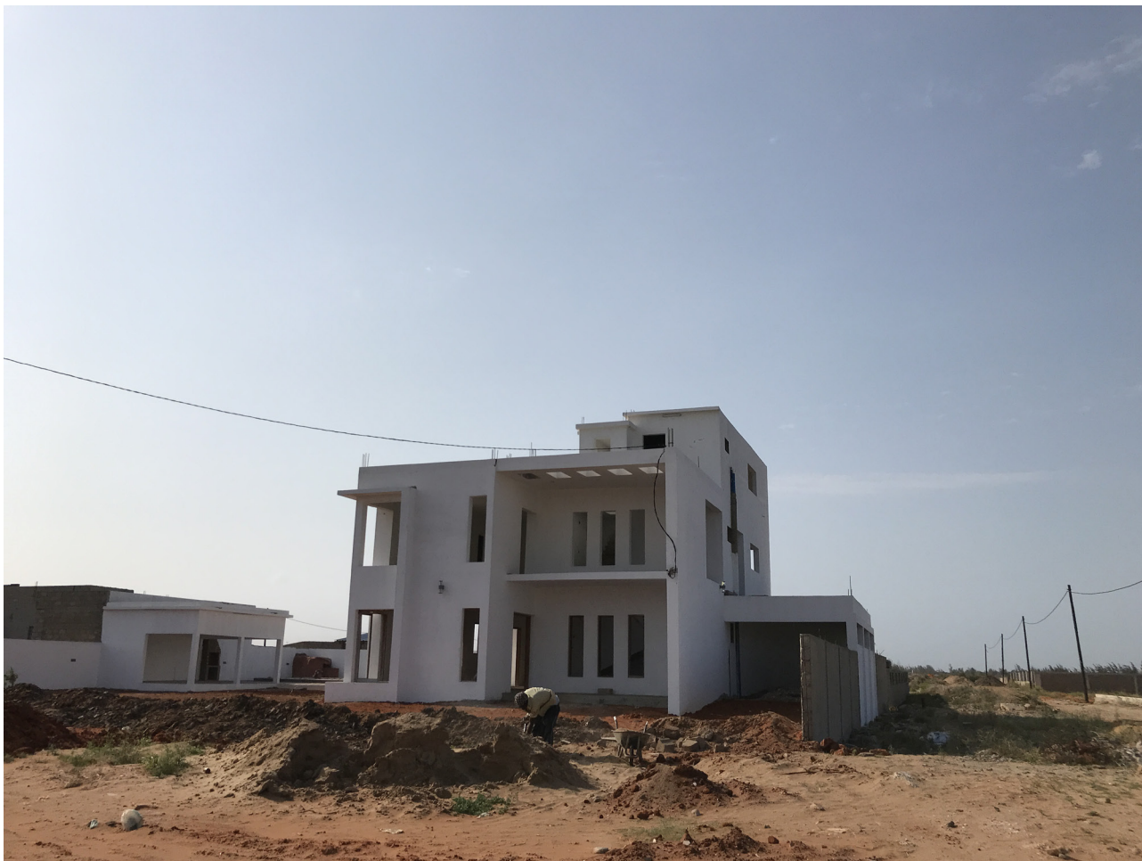
Tekst Byggeprojekt i udkanten af Maputo, Mozambique.

ningsprojektet omfatter fire underprojekter: et antropologisk studie af udliciteret byplanlægning, et arkitektonisk studie af middelklasse-byggerier, et urbanitetsstudie af privatiserede beboelsesområder og et historisk studie af anlægningen af større nabolag i perioden omkring Mozambiques uafhængighed i 1975. Projektet er finansieret af Danmarks Frie Forskningsfond og er forankret i Danmarks Oldtid og Middelalder.