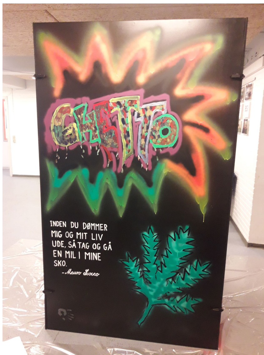
Pop-up udstillingen produceret af lokale beboere i det almene boligområde Lindholm. Vi elsker Lindholm udstilledes på skiftende steder, så som boligområdet og det lokale bibliotek.

Projekt afsluttedes i februar 2020 med en konference med deltagere fra fonde, forskere og museumsformidlere. Konferencen bød bl.a. på en diskussion mellem 7 museumsdirektører om spørgsmålet om, hvilken rolle kan et projekt som CULINN kunne spille i en tid, hvor museerne i stigende grad både skal være kommer-cielle, levedygtige institutioner og samtidig være demokratiske medspillere, der rækker ud efter nye målgrupper og ikke-brugere? Projektets resultater er samlet en publikation Mellem innovation og integration . Når museer møder nytilkomne borgere (2019), der gennem 11 artikler formidler projektets erkendelser og erfaringer. På projektets hjemmeside https://www.culinn.dk er der adgang til et rigt materiale af videofilm med projektdeltager-nes refleksioner og erkendelser. Her ligger også konkrete forslag til inkluderende formidlingsar-rangementer.