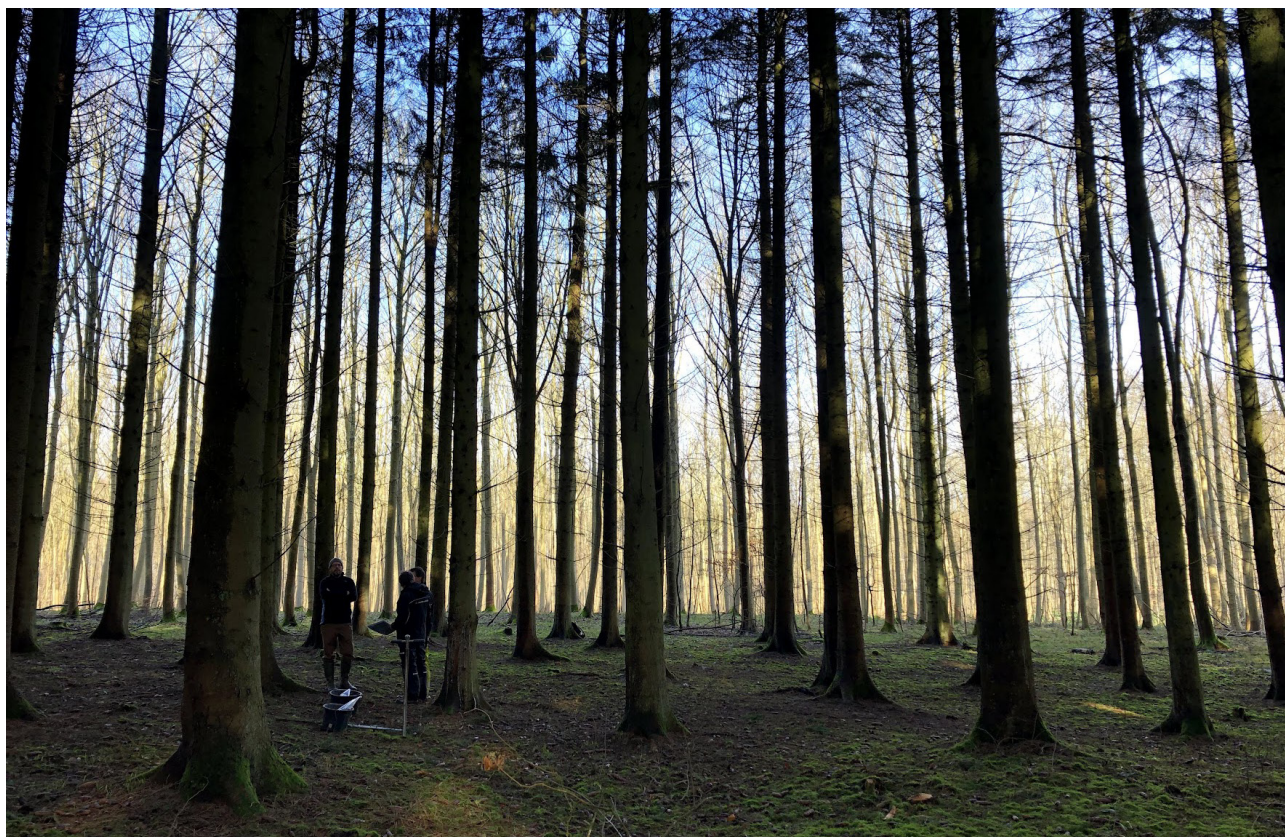
De store og velbevarede marksystemer ved Tårup Lunde, Fyn, har flere gange været genstand for undersøgelser. Denne gang ved en nyopmåling og udtagning af jordprøver til totalgrundstofanalyser.

Der er endvidere oprettet en betaversion af en fællesdatabase mellem Moesgaard og Nationalmuseet til oversigt og statistisk analyse af de samlede arkæobotaniske fund de to museers laboratorier har behandlet og som indgår i projektet.