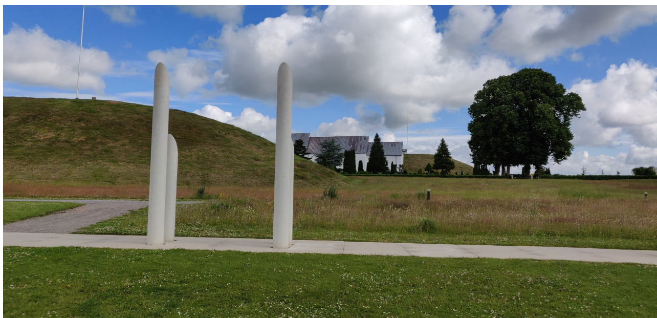
Jelling 2020. En forandret udsigt til højene og kirken; stolperne i forgrundene markerer den sydlige del af den mægtige palisade, der en gang stod omkring højene og runestenene.

Jellingprojektet har i 2020 fortsat sit samarbejde med VejleMuseerne vedrørende undersøgelser dels på fundstedet for en befæstet gård fra 700-/800-årene ved Erritsø ud til Lillebælt, dels ved gården Anesminde umiddelbart vest for Kongernes Jelling, der tænkes inddraget i den lokale kulturhistoriske