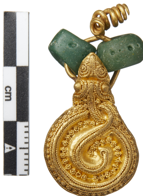
Den omtrent 3 cm store slangeamulet med to glasperler er et af de fineste detektorfund fra de seneste år. Miniaturslangen er sammen med andre miniaturer blandt de detektorfund, som projektet har undersøgt i 2020.

der betragter 'middelklasse-urbanisme' som de socio-kulturelle praksisser og strategier, der opererer på tværs af adskillelsen mellem det lovlige og det ulovlige, det formelle og det uformelle, og som struktureres af ideer om en uforstyrret privatsfære og sikkerhed som værende afgørende faktorer for at kunne opnå et bedre liv i byen. Det er projektets hypotese at (1) 'middelklasse urbanisme' er en væsentlig drivkraft for de igangværende fysiske og materielle transformationsprocesser som byer i det sydlige Afrika i øjeblikket gennemgår og at (2) nye former for medborgerskab, som har byen snarere end nationalstaten som politisk fællesskab, opstår som resultat af disse urbaniseringsprocesser. Forsk-