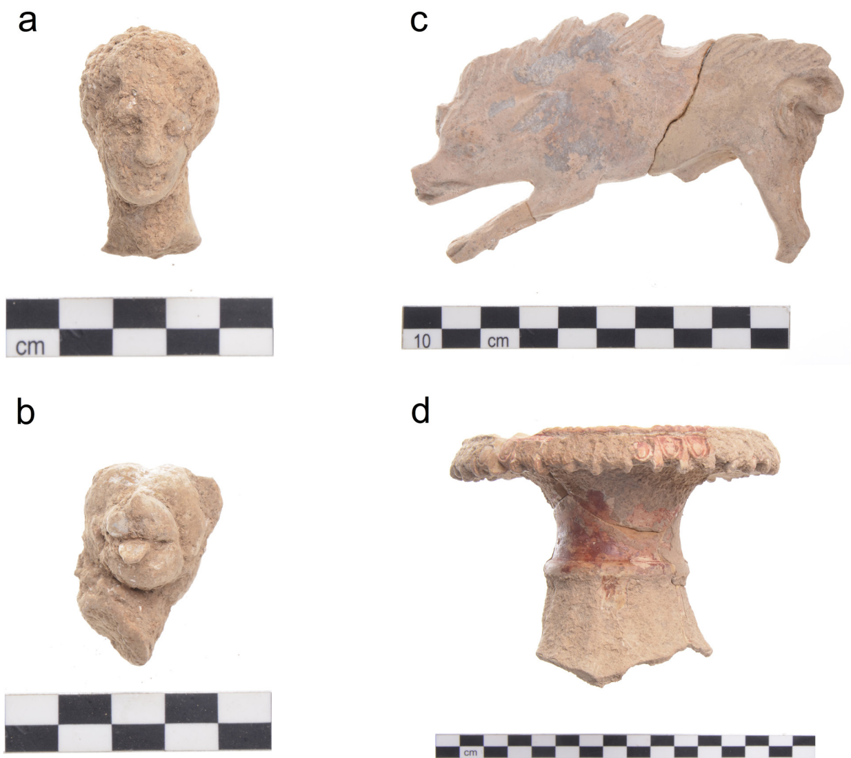
Fragmenter fra menneske- og dyrefiguriner fundet i et gravmonument fra senklassisk/tidlig hellenistisk tid i den gamle Sikyon